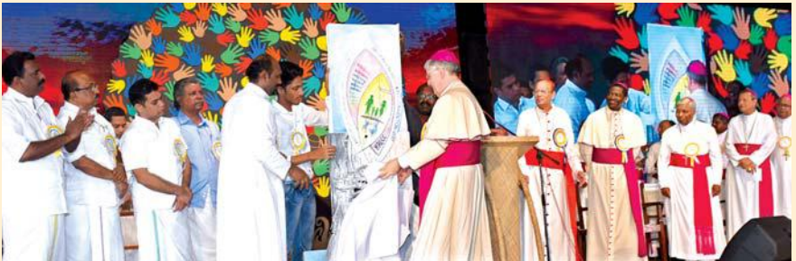
എക്സിബിഷൻ ഉദ്ഘാടനം നൂറുശ്ചോ ആർച്ച്ബിഷപ്പ് ജാംബത്തിസർ ദികയാത്രോ നിർവ്വഹിക്കുന്നു.