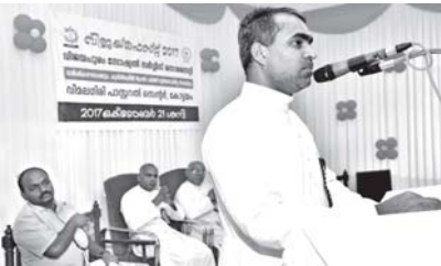
കൃതജ്ഞത ഫാ ജോൺസൺ ഒറ്റത്തങ്ങുകൽ