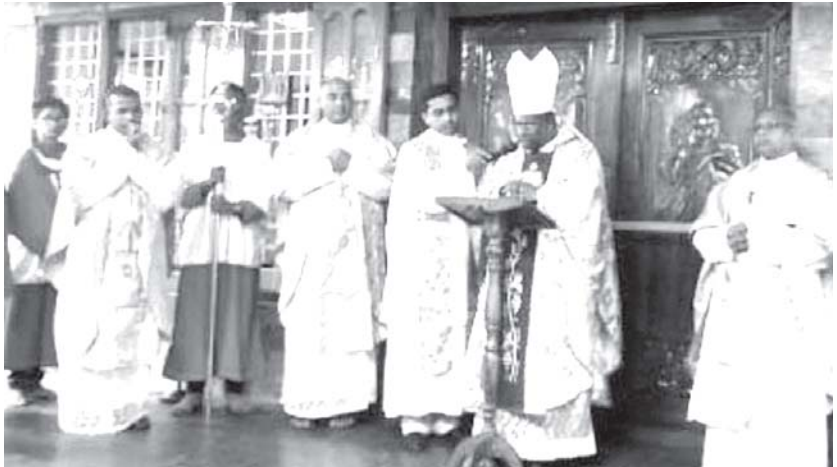
Thokkupara Church Blessing, 24-9-2017