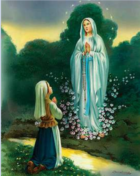
പരി. ലൂർദ്ദ് മാതാവിന്റെ തിരുനാൾ: 2018 ഫെബ്രുവരി 11