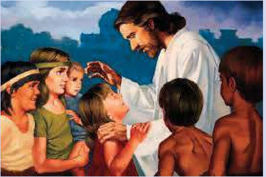
തിരുബാലസഖ്യ ദിനം: 2018 ഫെബ്രുവരി 11