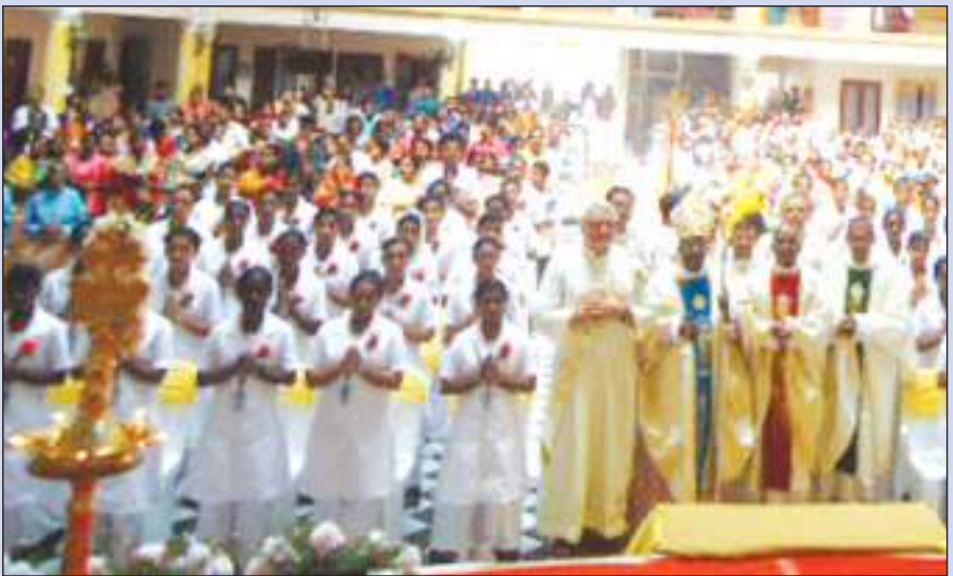
മുക്കുട്ടുതറ അസ്സീസി കോളേജിൽ നടന്ന ദീപം തെളിക്കൽ ചടങ്ങ്