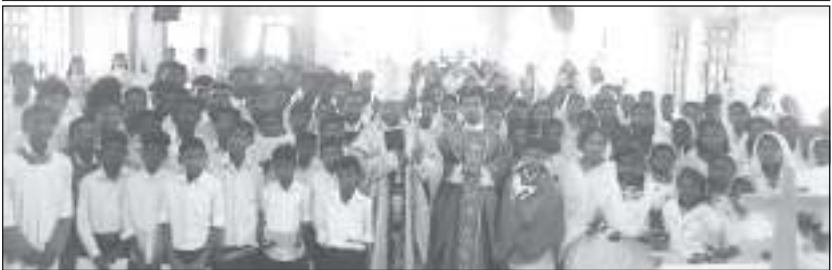
ചെണ്ടും സെന്റ് ജോസഫ്സ് ദൈവാലയത്തിലെ സ്നേഹമുദ്രപ്രദാനം

ഫ്രാൻസിസ് പാപ്പാ പി.ഒ.സി., കേരള കത്തോലിക്കാസഭയുടെ ആസ്ഥാനകാര്യാലയം കൊച്ചി - 682 025