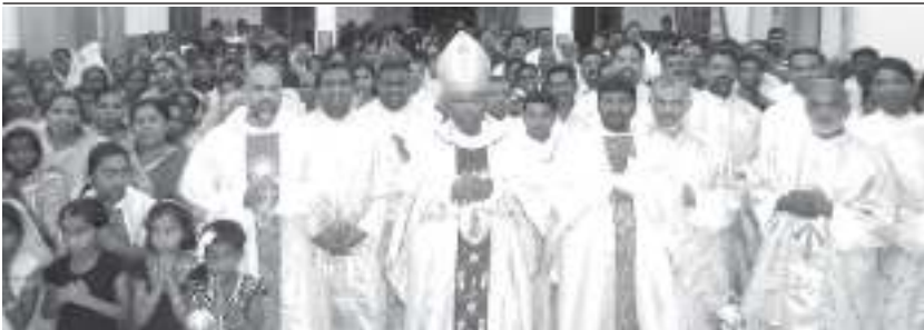
ഹെലിബെറിയാ സെന്റ് ജോസഫ്സ് ദൈവാലയത്തിന്റെ ആശീർവാദ വേള

“പുതിയ ജന്മം, നന്മതൻ കിരണം, ഈ തപസ്സുകാലം നൽകി നീ എൻ ജീവിതത്തിൻ വഴിത്താരയായി”