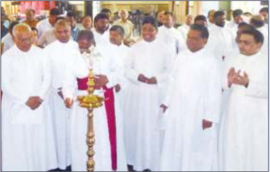
വിജയപുരം 9-ാം പാസ്റ്ററൽ കൗൺസിലിന്റെ നാലാം സമ്മേളന ഉദ്ഘാടനം