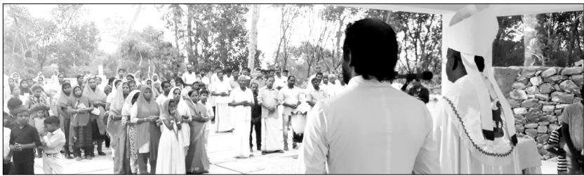
ആണ്ടൂർ ഇടവകയുടെ നവീകരിച്ച സെമിത്തേരി അഭിവാന്ദ്യ പിതാവ് ആശീർവ്വദിക്കുന്നു