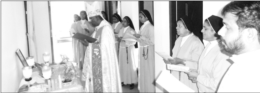
ചെങ്ങളം കോൺവെന്റ് അഭിവന്ദ്യ പിതാവ് തിരുഹൃദയത്തിന് പുനഃപ്രതിഷ്ഠിച്ച വെഞ്ചരിപ്പു കർമ്മം നടത്തുന്നു

ജീവിതത്തിലെ വേദനകളോടൊപ്പം നമുക്കും പ്രാർത്ഥിക്കാം, കർത്താവേ എന്റെ കുരിശിനും ഭാരമുണ്ട്. പലപ്പോഴും കുരിശിനൊപ്പം ഞാനും നിലത്തുവീണു പോകുന്നു. എന്നെ സഹായിക്കുവാനോ ഒരാശ്വാസവാക്കു പറയുവാനോ ആരെയും കാണുന്നില്ല. അതിനാൽ അങ്ങു തരുന്ന സഹനങ്ങളെ സന്തോഷത്തോടെ സ്വീകരിക്കാനുള്ള കൃപതരണമേ. ആമേൻ.