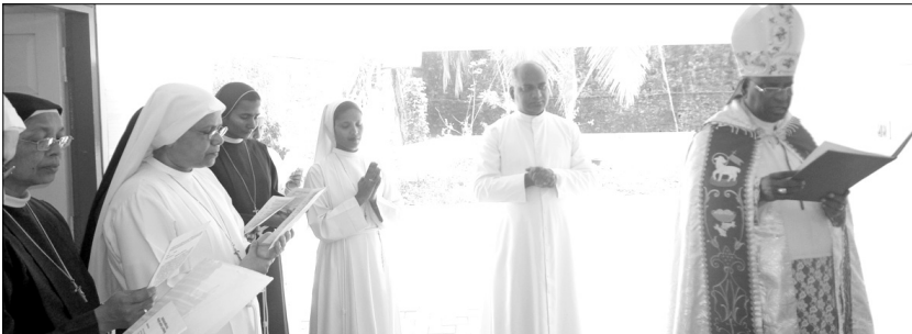
മുക്കുട്ടുതറ അസിസ്റ്റി കോൺവെന്റ് അഭിവന്ദ്യ പിതാവ് തിരുഹൃദയത്തിന് പുനഃപ്രതിഷ്ഠിച്ച വെഞ്ചരിപ്പു കർമ്മം നടത്തുന്നു