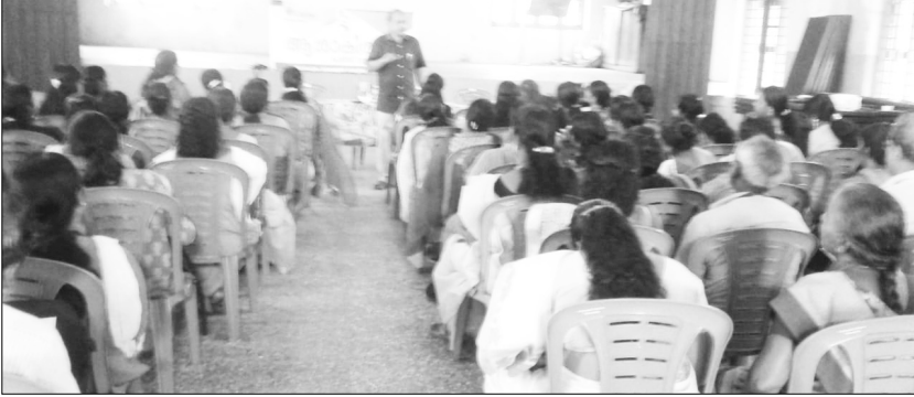
കാൻസർ ദിനാചരണം തിരുവല്ല മേഖല