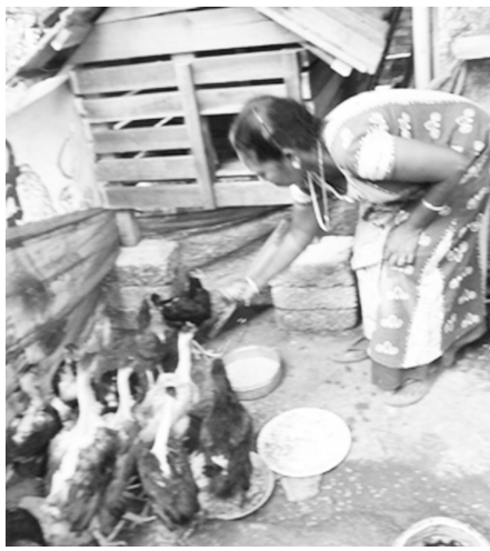
വീ ഷെയർ പദ്ധതി : വരുമാന വർദ്ധക സംരംഭം കാഞ്ഞിരപ്പാറ