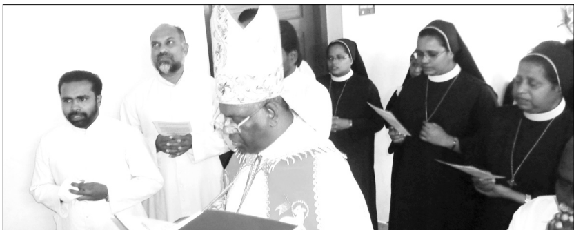
കുമളി വൈദിക വസതിയുടെ വെഞ്ചുരേഷും തിരുഹൃദയ പുനഃപ്രതിഷ്ഠാകർമ്മവും