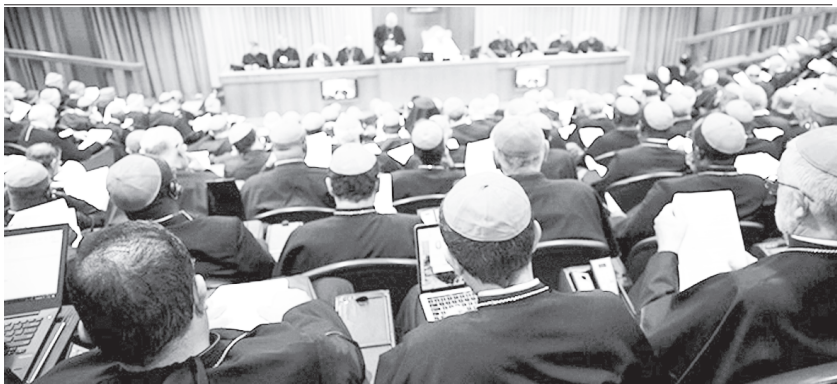
2018 ഒക്ടോബർ 03ന് വത്തിക്കാനിൽ നടന്ന മെത്രാന്മാരുടെ സാധാരണ സിനഡിന്റെ പ്രാരംഭം