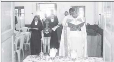
സി.എസ്.എസ്.റ്റി കേൺവെന്റ് ചിന്നക്കനാൽ