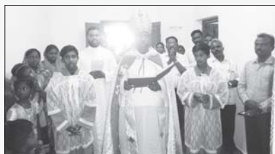
വൈദിക വസതി ഗുഡാർജെ