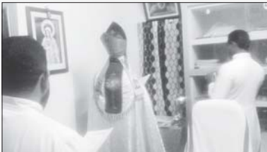
വൈദിക വസതി വെള്ളിയാമറ്റം