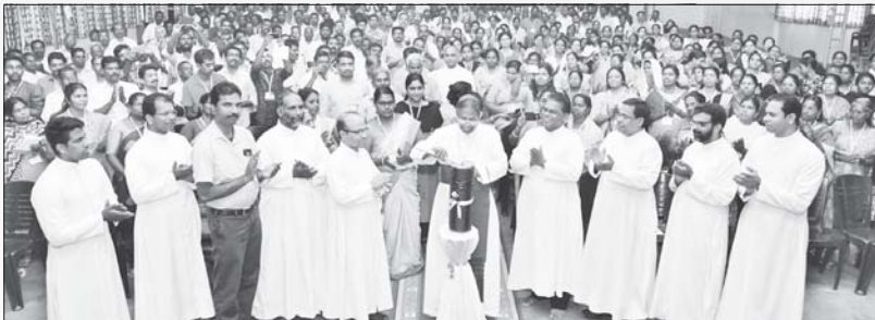
കെ.ആർ.എൽ.സി.സി. പരിശീല പരിപാടി