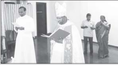
വൈദിക വസതി നട്ടാശ്ശേരി