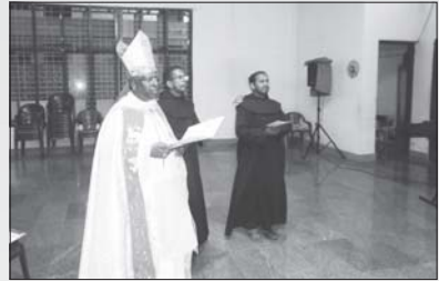
സന്യാസ ഭവനം തിരുവല്ല