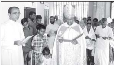
വൈദിക വസതി പെരുംപെട്ടി