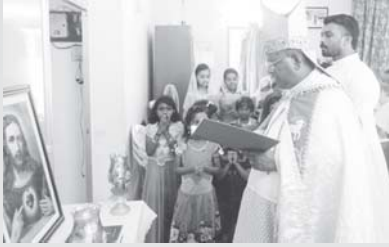
വൈദിക വസതി ഏന്തയാർ