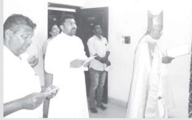
വൈദിക വസതി വെട്ടിമുകൾ