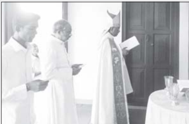
വൈദിക വസതി പൊതി