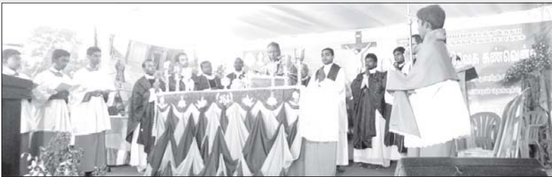
ബൈബിൾ കൺവൻഷൻ സമാപനബലി, പാവനാർ