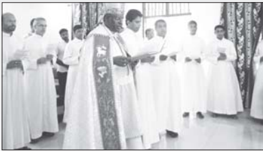
സന്യാസ ഭവനം കഞ്ഞിക്കുഴി