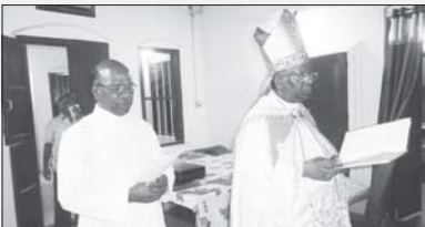
വൈദിക വസതി മാത്തുണ്ടാലം