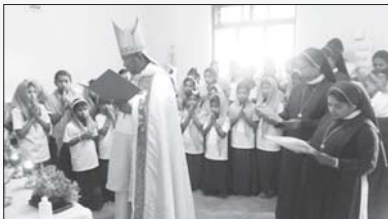
സി.റ്റി.സി. കേൺവെന്റ് പയസ് നഗർ