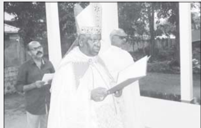
വൈദിക വസതി റാന്നി