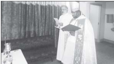
വൈദിക വസതി മുക്കുട്ടുതറ