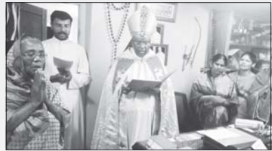
വൈദിക വസതി പള്ളിവാസൽ