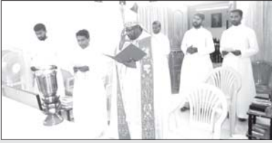
സന്യാസ ഭവനം പാമ്പാടി