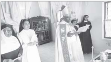
കോൺവെന്റ് റെജിനാമുത്തി തിരുവല്ല