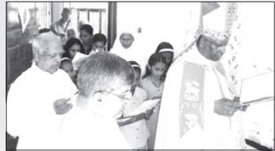
വൈദിക വസതി വൈശ്യംഭാഗം