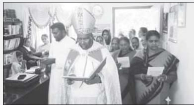
വൈദിക വസതി ചിന്നക്കനാൽ