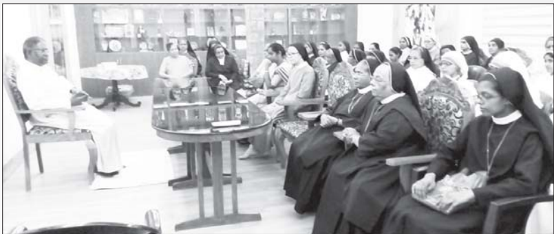
ഈസ്റ്ററിനോടനുബന്ധിച്ച് രൂപതയിൽ സേവനം അനുഷ്ഠിക്കുന്ന സിസ്റ്റേഴ്സിന്റെ കൂടിവരവ്