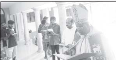
വൈദിക വസതി മധുരവേലി