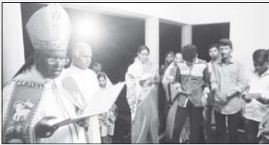
വൈദിക വസതി വനവാതുക്കര