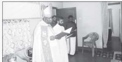
വൈദിക വസതി മണ്ണയ്ക്കനാട്