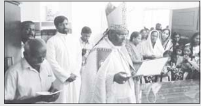
വൈദിക വസതി നെടുങ്ങപ്ര