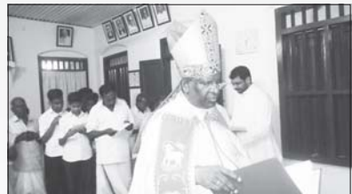
വൈദിക വസതി പെരുവ