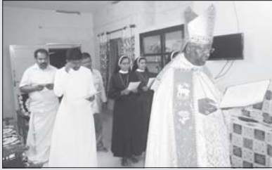
സന്യസ്ത ഭവനം മാരാമൺ