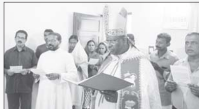
വൈദിക വസതി മുവാറ്റുപുഴ