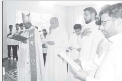
സന്യാസ ഭവനം ഏറ്റുമാനൂർ