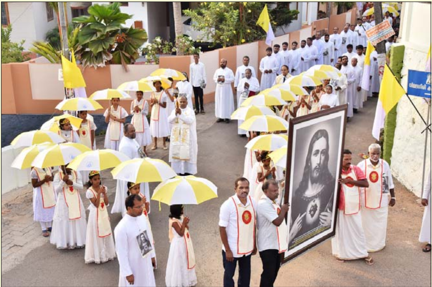
വിജയപുരം രൂപതയുടെ തിരുഹൃദയവർഷ സമാപനത്തോടനുബന്ധിച്ചു കോട്ടയത്തു നടന്ന റാലി