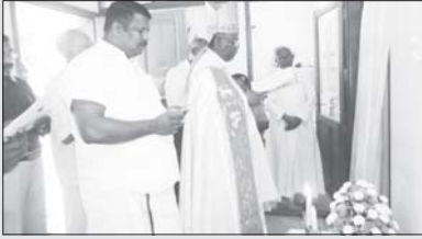
വൈദിക വസതി പാക്കിൽ