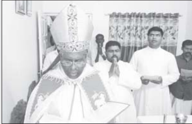
വൈദിക വസതി ബിയൽറാവ്