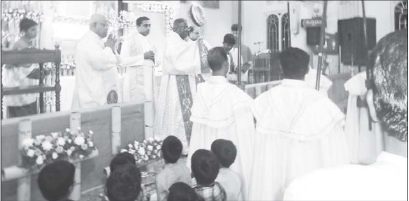
40 മണി ആരാധന, നല്ലയിടയൻ പള്ളി, കോട്ടയം