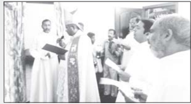
വൈദിക വസതി കുറുമുളൂർ