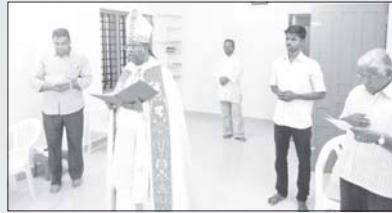
സന്യാസ ഭവനം മൂരിക്കുംതൊട്ടി