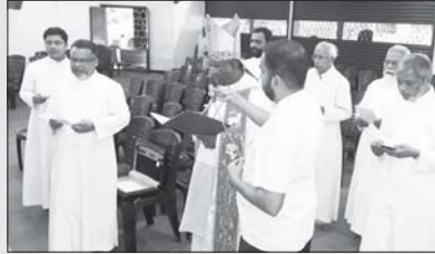
കാരിസ് ഭവൻ, അതിരമ്പുഴ