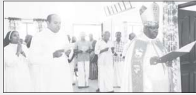
വൈദിക വസതി ചാത്തൻതറ