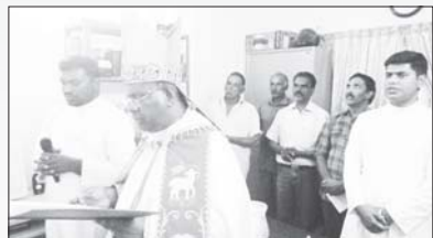
വൈദിക വസതി സൂര്യനെല്ലി