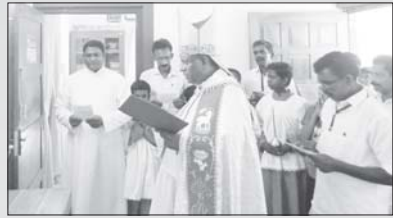
വൈദിക വസതി പൊടിമറ്റം