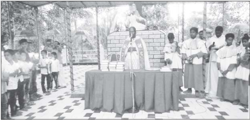
കുറുമുളൂർ കുരിശുപള്ളി ആശീർവാദം