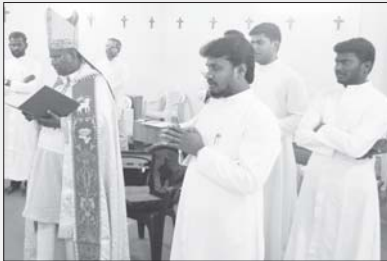
സന്യാസ ഭവനം ചിന്നകനാൽ