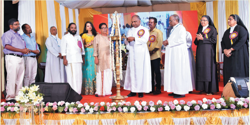
വി ഫെസ്റ്റ് 2019 വികാരി ജനറാൾ മോൺ. ജസ്റ്റിൻ മറത്തിൽപറമ്പിൽ ഉദ്ഘാടനം ചെയ്യുന്നു