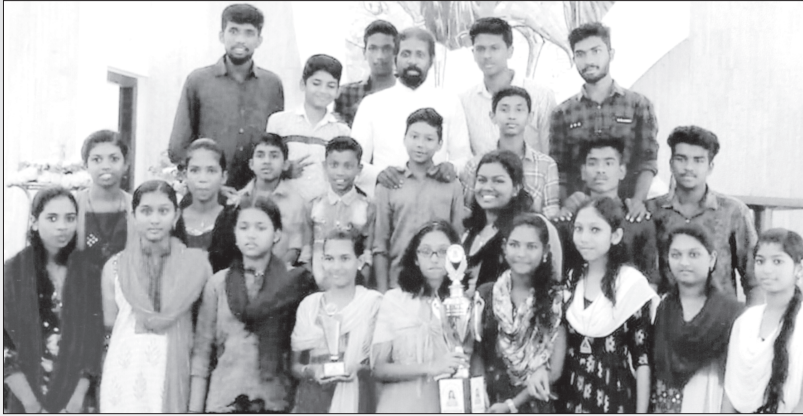
തിരുവല്ല മേഖല ബൈബിൾ കലോത്സവത്തിൽ ഒന്നാം സ്ഥാനം കരസ്ഥമാക്കിയ മാരാമൺ സെന്റ് ജോസഫ്സ് ഇടവകാംഗങ്ങൾ വികാരിയച്ചനോടൊപ്പം