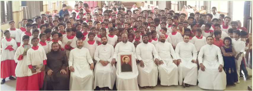
അൾത്താരബാല സംഗമം വിമലഗിരിയിൽ-കോട്ടയം മേഖല