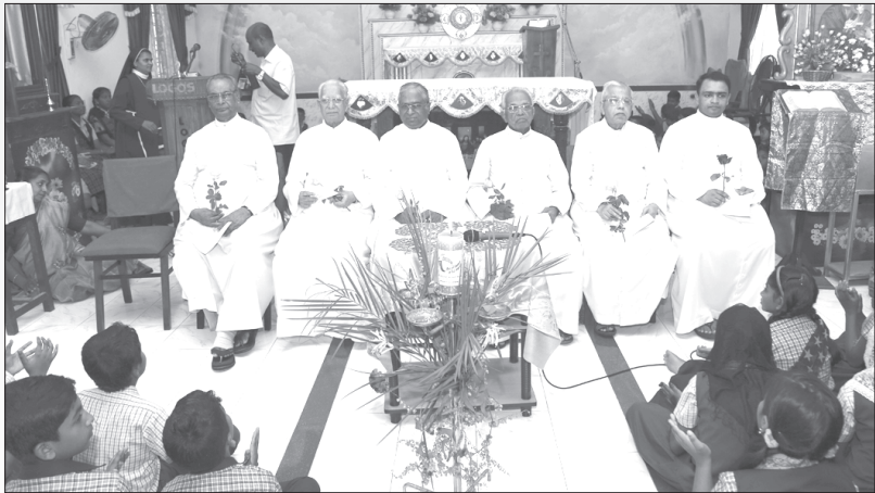
അസാധാരണ മിഷൻമാസത്തോടനുബന്ധിച്ച് ഹോളിഫാമിലി ഹൈസ്കൂളിൽ വൈദികരെ ആദരിച്ചപ്പോൾ