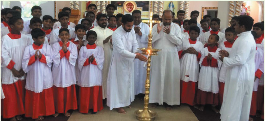
അൾത്താരബാല സംഗമം പീരുമേട് മേഖല