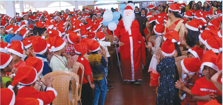
ക്രിസ്മസ് ആഘോഷം അമലാംബിക സ്കൂൾ, തേക്കടി