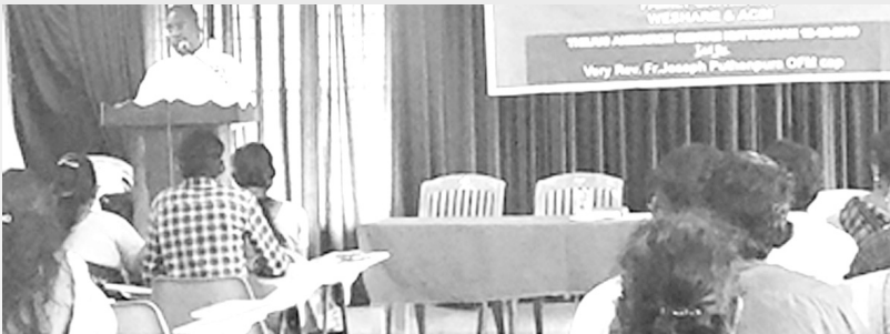
അഭിവന്ദ്യ പിതാവിന്റെ അനുഗ്രഹ പ്രഭാഷണം - വീ ഷെയർ, ആക്സി കൂടുംബ സംഗമം കുട്ടിക്കാനം