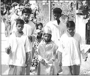
ക്രിസ്തുരാജന്റെ തിരുനാൾ-റാലി, തൊടുപുഴ വി. മദർ തെരേസ ദേവാലയം.