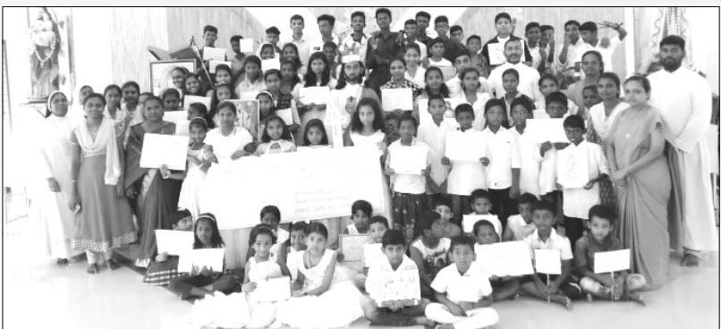
സെന്റ് മേരീസ് നട്ടാശ്ശേരി ഇടവകയിൽ ക്രിസ്തുരാജ തിരുനാൾ

പരിശുദ്ധ പിതാവിന്റെ ശുശ്രൂഷാജീവിതത്തിന്റെ നന്മകൾക്കായി ദൈവത്തിനു നന്ദിപറയുകയും പരിശുദ്ധ പിതാവിന്റെ നിയോഗങ്ങൾക്കായി പ്രത്യേകം പ്രാർഥിക്കുകയും ചെയ്തു.