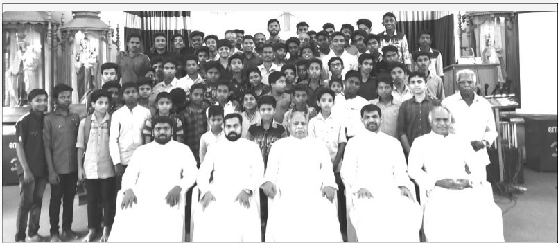
തിരുവല്ല മേഖല അൾത്താരബാലസംഗമം

ജീവിതം സംഭവങ്ങളുടെ വെറും പരമ്പരയല്ല. അത് ഒരു പ്രക്രിയയാണ്. ഒരു ഒഴുക്ക്, ഒരു മുന്നേറ്റം. അബ്രഹാമിന്റെ ഇറങ്ങിത്തരികെലും മോശയുടെ നേതൃത്വത്തിൽ ഇസ്രായേൽ ജനത്തിന്റെ പുറപ്പാടും യേശുവിന്റെ മനുഷ്യാവതാരവും ജീവിതവും മരണവും ഉത്ഥാനവും സ്വർഗ്ഗാരോഹണവും സഭയുടെ ചരിത്രവുമെല്ലാം ആ പ്രക്രിയയിലുള്ള പങ്കുചേരലാണ്. അവിടെ വെറും കാണികളായി നിന്നുപോകാതെ, ഉപ്പുതുണുകളായി ഉറച്ചുപോകാതെ സജീവപങ്കാളികളായി ഉത്സാഹത്തോടെ നമുക്കു മുന്നേറാം. പുതുവർഷത്തിലൂടെ, ഉണർവ്വോടെ ഊർജ്ജസ്വലതയോടെ മുന്നേറാൻ വേണ്ട ഓർമ്മപ്പെടുത്തലും ആഹ്വാനവുമാണ് ഈ പുതുവർഷാരംഭം. 2020 ഏവർക്കും അനുഗ്രഹത്തിന്റെയും ഐശ്വര്യത്തിന്റെയും അനുഭവമാകട്ടെ, അനുഭവമേകട്ടെ എന്ന് ഹൃദയപൂർവ്വം ആശംസിക്കുന്നു.