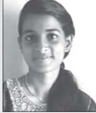
സമീക്ഷ സജി വൈശ്വംഭരം