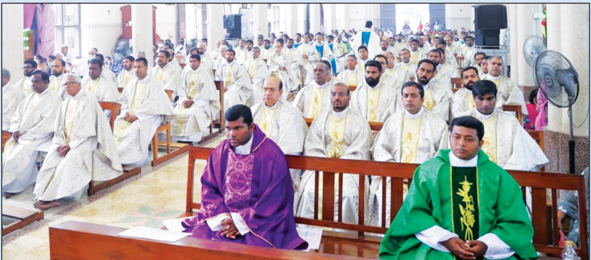
2022 വൈദികദിനത്തിലെ വൈദികക്കൂട്ടായ്മ