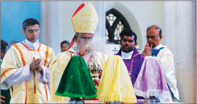
തിരുത്തെലങ്ങൾ അഭിവന്ദ്യ പിതാവ് ധൂപികുന്നു