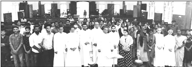
മുണ്ടക്കയം മേഖല യുവജന-മതാധ്യാപക സിനഡ്