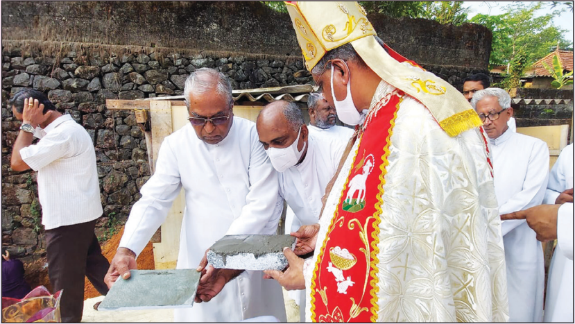
മ്യൂൺസ്റ്റർഷ്യാർസ്വാഗ് മിഷൻ കോട്രേഴ്സിന്റെ കല്ലിടൽ കർമ്മം അഭിവന്ദ്യ പിതാവ് നിർവഹിക്കുന്നു