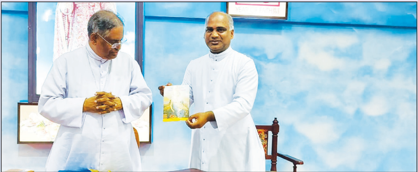
വിശുദ്ധ ശനിയാഴ്ചത്തെ പ്രഭാതപ്രാർത്ഥനാപുസ്തകം പ്രകാശനം ചെയ്യുന്നു