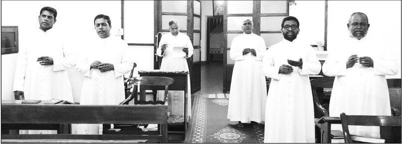
യുദ്ധം നടക്കുന്ന ഉക്രൈനനെ മാതാവിന് സമർപ്പിച്ചുകൊണ്ടുള്ള പ്രാർത്ഥന