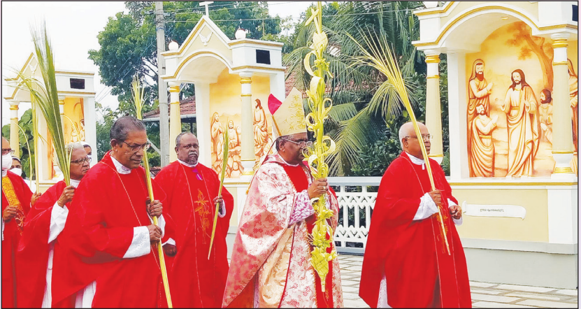
കുരുത്തോല ഞായർ ആചരണം വിമലഗിരി കത്തീഡ്രലിൽ