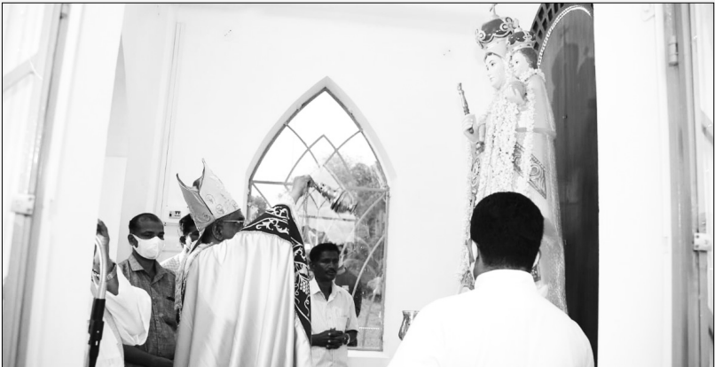
വൈശ്യാഭാഗം വേളാങ്കണ്ണിമാതാ കുരിശടി ആശീർവാദം