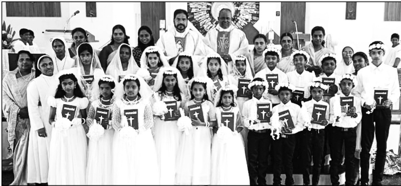
ആദ്യകൂർബാനസീകരണം സെന്റ് സെബാസ്റ്റ്യൻ ദൈവാലയം ചീന്തലാർ