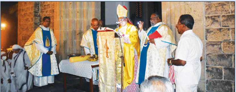
ഉയിർപ്പ് തിരുനാളിൽ പുത്തൻ തി, തിരി ആശിർവാദം