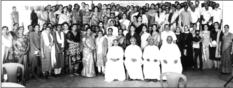
തിരുവല്ല മേഖല മതാധ്യാപക സിനഡ്