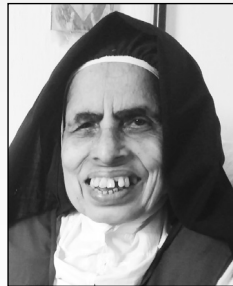
റവ. സി. മേരി ഗ്രേറ്റ് കാർമ്മൽ കോൺവെന്റ് (മിണ്ടാമം) കോട്ടയം