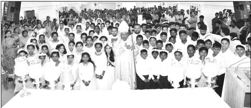
സൈമ്രിയലേപനകർമ്മവും ഇടയസന്ദർശനവും സൂര്യനെല്ലി