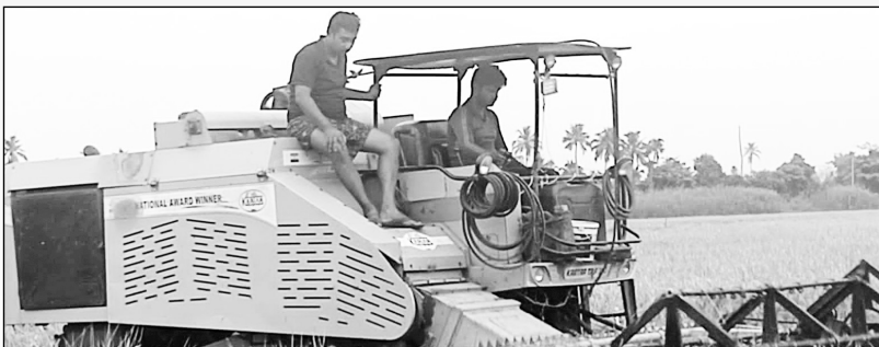
വേളൂർ വിശ്വാസ് പുരുഷസംഘത്തിന്റെ നെൽകൃഷി വിളവെടുപ്പ്