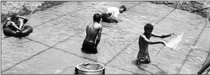
പൊടിമറ്റം ദീപ്തി അയൽക്കൂട്ടത്തിന്റെ മത്സ്യ വിളവെടുപ്പ്