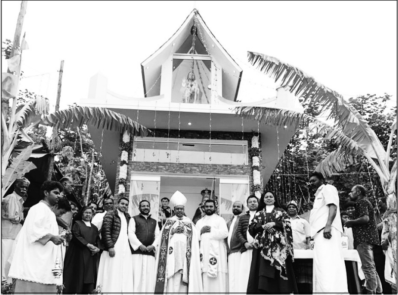
അന്നെ വേളാങ്കണി കുരിശടി ആശീർവാദം- അപ്പർ സൂര്യനെല്ലി