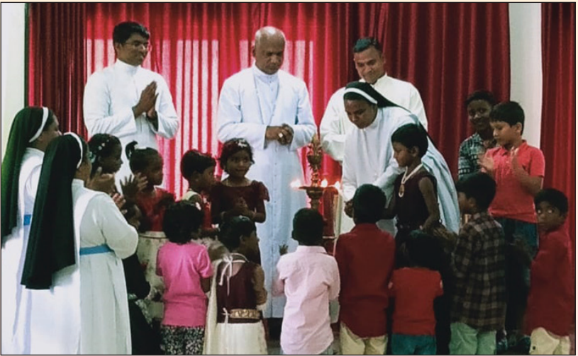
തിരുബാല സഖ്യ ദിനാഘോഷം മൂന്നാർ ഫൊറോന