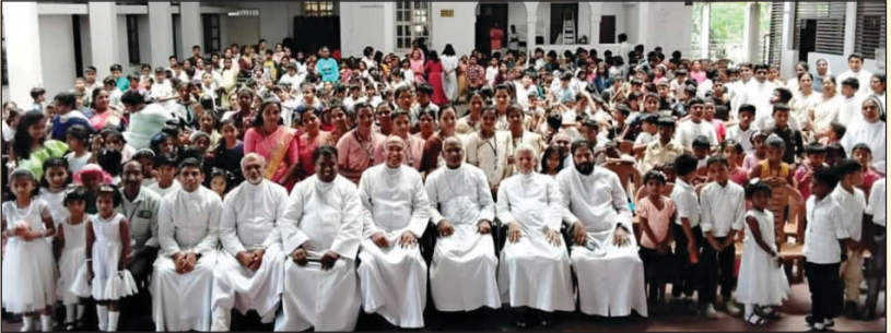
തിരുബാല സഖ്യ ദിനാഘോഷം പീരുമേട് മേഖല